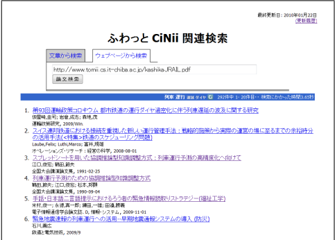
図 3 「ふわっと CiNii 関連検索」の検索結果画面例

テキストを直接入力する「文章から検索」と、指定 URL をもとに検索する「ウェブページから検索」の 2 種類をタブ型インターフェースにより用意している。また、どのような検索がおこなわれるかイメージしやすいよう、朝日新聞、日本経済新聞の 2 紙の社説記事と毎日新聞のコラム記事「記者の目」を使った検索例を試すリンクを付けている。さらに図 3 に、検索結果画面例を示す。検索結果一覧に表示された論文タイトルからは、CiNii 上の当該論文へリンクが張られている。