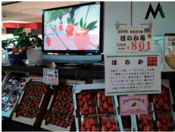
図-3 高付加価値型販売ソリューションを適用した作物販売(イチゴ)の様子

で多数の取り組みがなされており、その成果を適用することで対応が見込まれる。たとえば、トマトやイチゴ等の作物については、栽培ベッドを用いることで対応が可能である。これは、火山灰や燐炭等を原料とした特定の栽培用土壌を発泡スチロール性等の細長いケースに入れたもので、安価に設置することが可能なため、熟練農家を始め、国内各地で採用されている。これらの既存成果を活用し、作物の生育への人間行為からの影響と、自然環境からの影響との分離が可能な状況を造り上げていくことが求められる。