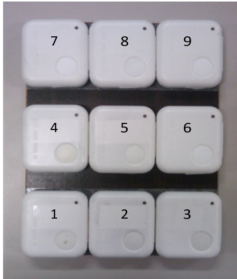
図5 9個のセンサを配置した実験用盤面 Fig.5 An experimental board with nine sensors.

さらに、加速度と角速度はスケールが異なり等価に扱うことが出来ないため、次に従い正規化し、D次元の特徴ベクトル Z(t) = (z_1(t), z_2(t), \dots, z_D(t)) (平均0, 分散1) を得る。