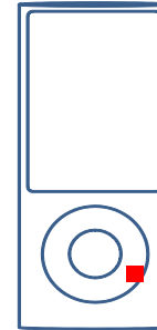
図 1 iPod Fig.1 iPod

また図 1 から図 4 に iPod、iPhone、Wii リモコン、T-Mobile G1 内に搭載されているセンサの位置を示す。ただし、T-Mobile G1 の加速度センサは地磁気センサと同一チップである。これらのデバイス内のセンサの位置は決まっておらず、特に同じ Apple Inc. 製のデバイスである iPod と iPhone のセンサの位置も統一されておらず、センサの位置は基盤の実装