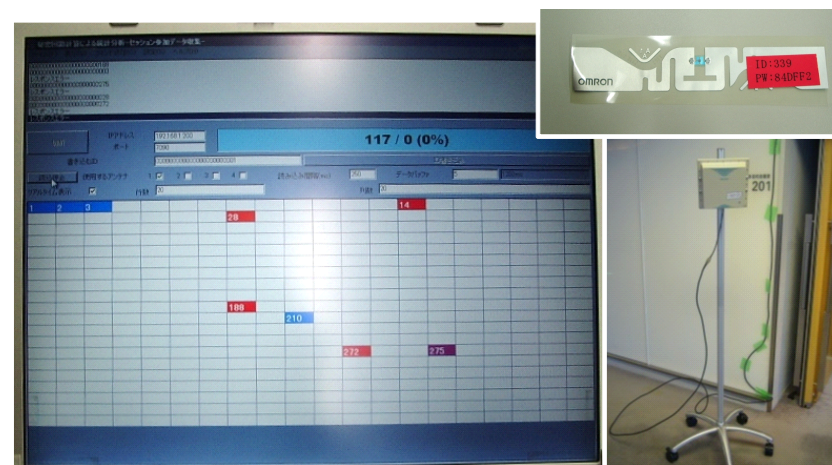
図 3 左: RFID 制御ソフトウェア表示画面, 右上: RFID タグ (V750-D22M01-IM), 右下: RFID アンテナ (V750-HS01CA-JP)

分析は Microsoft Excel 上に秘密アンケートシステムによる属性情報及び RFID システムによる行動ログをすべて集約し、前述のタグ ID 及び RFID パスワードをキーにしてデータ結合を行った。実施した分析は以下の 3 つである。なお実験結果の詳細・グラフは [文献 5)]