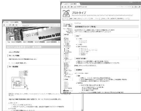
図1 Wikiによる運営活動と実習支援

した。これに対し ML や Wiki は、同じ時間を共有する必要がなく、多人数での利用に適した。特に、Wiki は、データの蓄積・更新が容易で閲覧性が高く、プロジェクト管理情報や、作業の進捗情報の交換などに役立った（図1 右上）。実際の運営では、ML、Wiki を中心に使用し、IM で定期的な連絡をとる形で進めた。約10ヶ月の運営期間で、ML の投函数は約2,000通に、Wiki のFrontPage の閲覧数は約10,000回にのぼった。