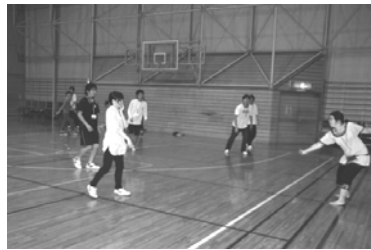
図6 レクリエーション