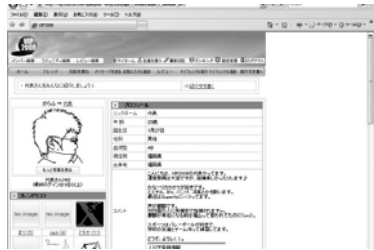
図5 SNS メンバページ