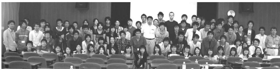
図 1 参加者の集合写真