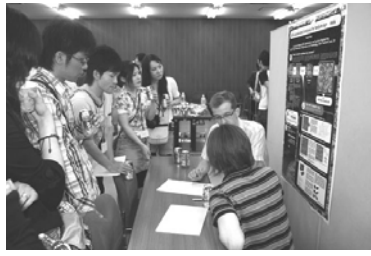
図3 英語セッション