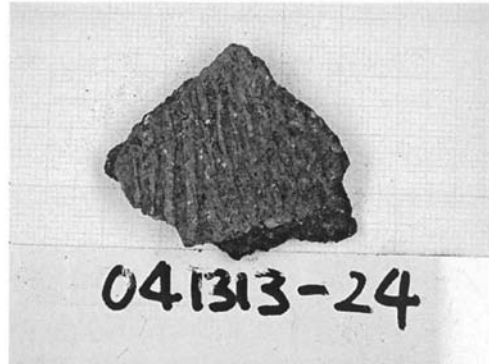
写真1 考古学写真の例（土器破片）

遺跡発掘時には様々な種類のフィルムに写真が撮影されている。枚数的に最も多いのは35mmフィルムであるが、それ以外にも6×6のサイズは4×5のサイズのフィルムが使用されている。また白黒フィルムで撮影されているものもあれば、カラーフィルムで撮影されているものもある。これらのフィルムの使い分けは、撮影にかかるコストも考慮されて決定されている。当然、4×5のサイズで撮影されるものは重要である傾向があるが、中には35mmフィルムでも重要なものもある。考古学写真を電子化する目的の一つには、退色を始めとした写真の劣化を防ぐことがある。このため可能な限りでの高解像度で電子化を行い、画像データは圧縮を行わずに保存することとした。対象となる考古学写真として、兵庫県香住