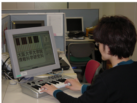
図 3: システムの使用風景

今回のデモセッションでは、モバイルクラヴィアを用いたパフォーマンスとして文字入力操作、マウス操作、ウィンドウ操作を実際に体験していただく。これまでに発表した文字入力方式に加えて、新たな文字入力方式や、学内でのアンケート結果等を紹介し、演奏でコンピュータを操作することの可能性について議論したいと考えている。