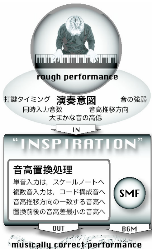
図 2: システムの全体像

INSPIRATION を利用した演奏状況については、 http://ist.ksc.kwansei.ac.jp/~katayose/members/yatsui/inspiration001.html から閲覧できる。