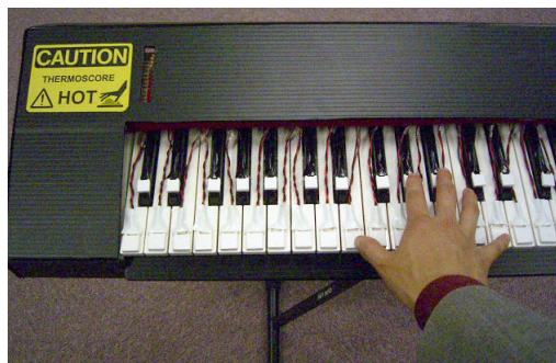
図5：ペルチェ素子を配置した鍵盤

各鍵盤には、下図のようにペルチェ素子を配置している。これは片側の面から反対側の面へと熱を移動させる素子で、極性を反転させることにより加熱・冷却が切り替えられる。システムは MIDI 情報を受信し、それに応じて鍵盤の温度を変化させることができる。