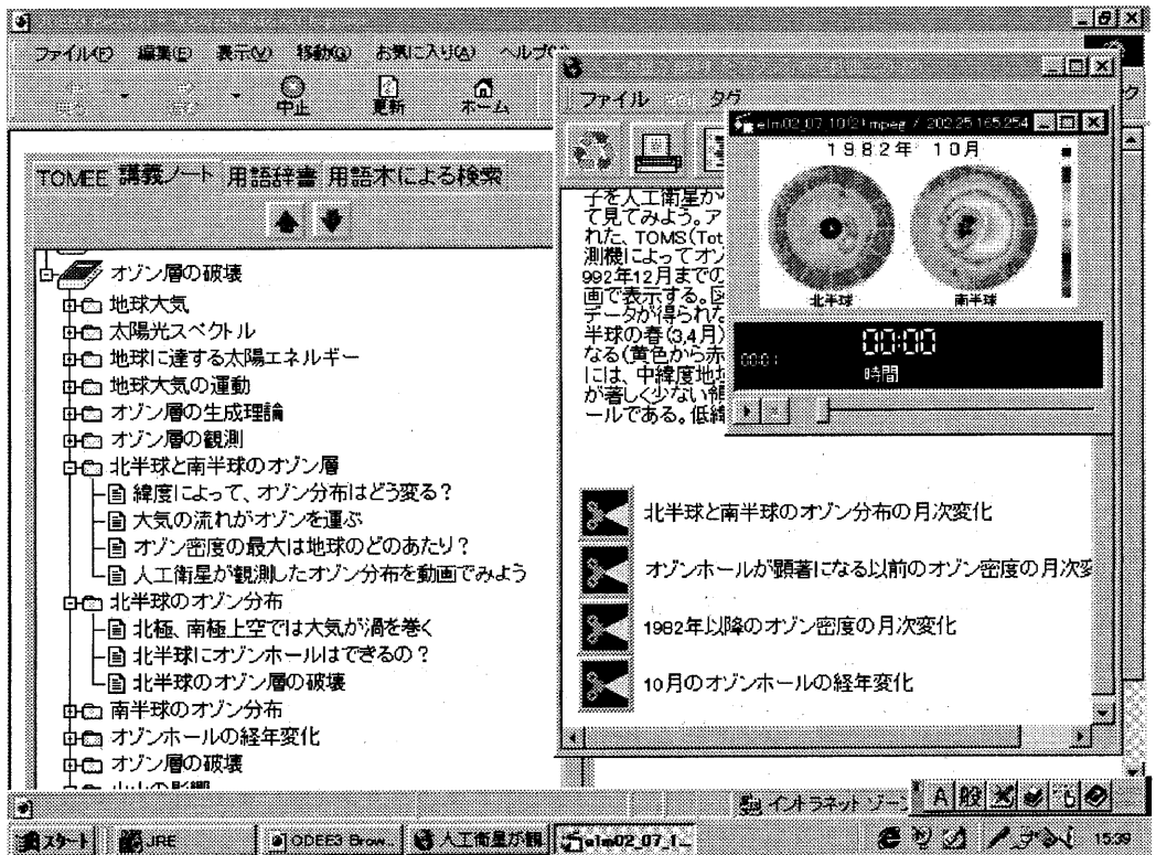
図3 主題「北半球と南半球のオゾン層」の学習例

図3は主題「北半球と南半球のオゾン層」の学習画面である。ここでは、緯度によるオゾンの分布が大気の流れによって生じることを学習する。