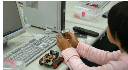
図7 赤外線によるプログラム転送

図8の制御プログラム例をスクリーンに映し、基本部分を入力させた後、自由にプログラミングを行った。児童たちは、最初はTV リモコンと違いリアルタイムに操作できないという不便さを感じつつも、自らが入力したコードの通りにロボットカーが動くことを体験することで、リモコン操作とは違った達成感をもって取り組んだ。