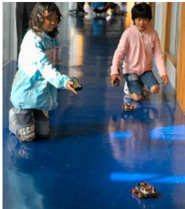
図6 TV リモコンでの操作

今回使用した logob.com[6] というタイプのロボットカーは、コンピュータからプログラムを転送して制御するほかに、TV リモコンによっても操作することが可能である。そこで、授業の最初に TV リモコンで操作することにより、児童がロボットカーを操作する要領を感覚的に体験できるようにした。今回の授業では、この機能はとても有効であった。図6に、TV リモコンで操作する様子を示す。