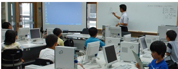
図 1 授業の様子

最初の2日間では、「ぼくもわたしもゲーム作家！」というタイトルで、タートルグラフィックスを使ったゲーム作品を作る授業を行った。図 1 に授業の様子を示す。