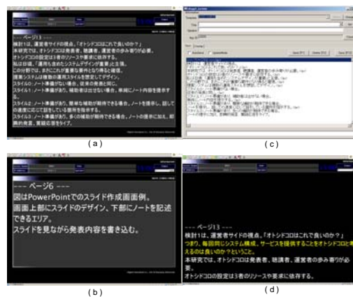
図3. ノート提示ツール

「--output--」以下の行を、提示用として出力したいといった要求や、URL は a 要素で囲みリンクを挿入したいといったように、スライド作成者