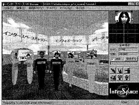
図 2 : インタースペース画面例

上記デザインの中で、特に重要なファクタとして、網掛けをした部分が挙げられる。インタースペースを特徴付ける映像・音声によるコミュニケ