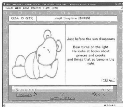
図 2.1 絵本の閲覧画面

の操作性を改善するため、現在の閲覧位置を明示し、絵本から絵本一覧へのリンクを追加した。また、英文の朗読や単語の発音を再生できるようにした。