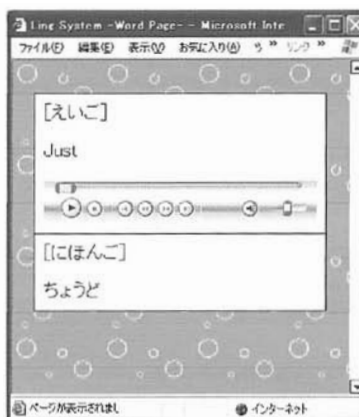
図 2.2 絵本の単語閲覧画面