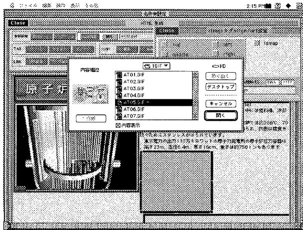
図1 インラインイメージの貼り付け操作1