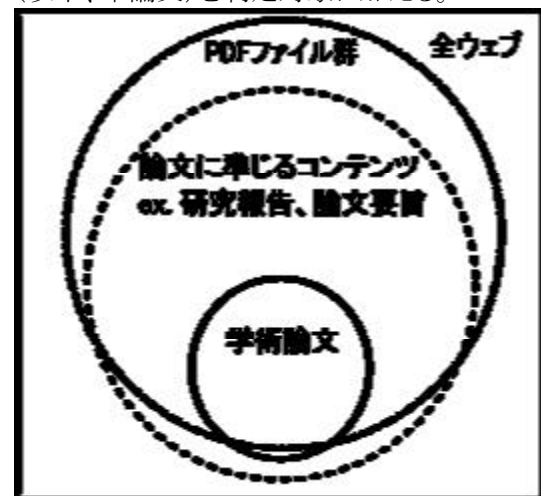
図1 ウェブ中の学術論文

ここでは学術論文の自動判定について検討していく際に、インフォーマルコミュニケーションをも包含した形での自動判定を目指していく。ただし、インフォーマルコミュニケーションの形はさまざまであるため、第一段階として、ここでは研究報告など、学術論文に準じるコンテンツ(以下、準論文)を判定対象に加える。