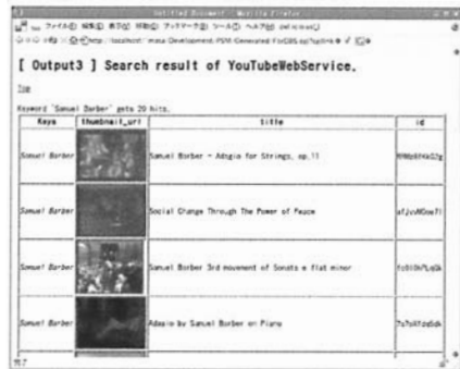
図 4 マッシュアップの実行図