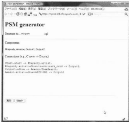
図1 PSM サイト

Meta-CGI search architecture (PSM) と呼ぶ。本章では PSM アーキテクチャの概要を実装したサーバの挙動を例にとって紹介する。PSM は単一のウェブサーバ (PSM サーバ) で実行される。PSM サーバにアクセスすると、テキストボックスなど入力インターフェースが表示され、ウェブサービス群を連携させるスクリプト (マッシュアップ・スクリプト) を記述することができる。CGI 生成のボタンが押されると PSM サーバは記述されたスクリプトに従ってマッシュアップ CGI を生成し、PSM サーバ自身で実行する。マッシュアップ CGI は PSM サーバ内で保存されるので、一度作成したマッシュアップ CGI をいつでも実行できる。連携するウェブサービスは事前に PSM サーバにモジュールを定義しなければならない。モジュールの定義方法は 3 章で述べる。