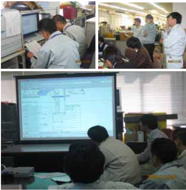
図 5. 実証実験の様子

各組織は、約 10 箇所程度の災害データの入力を行った。また、各組織から入力される情報を元に、実証実験時の指令室となった中丹東土木事務所にて、災害状況の全体像を把握し、必要な初期対策を行うための支援やシステムの有効性などについて検討した。