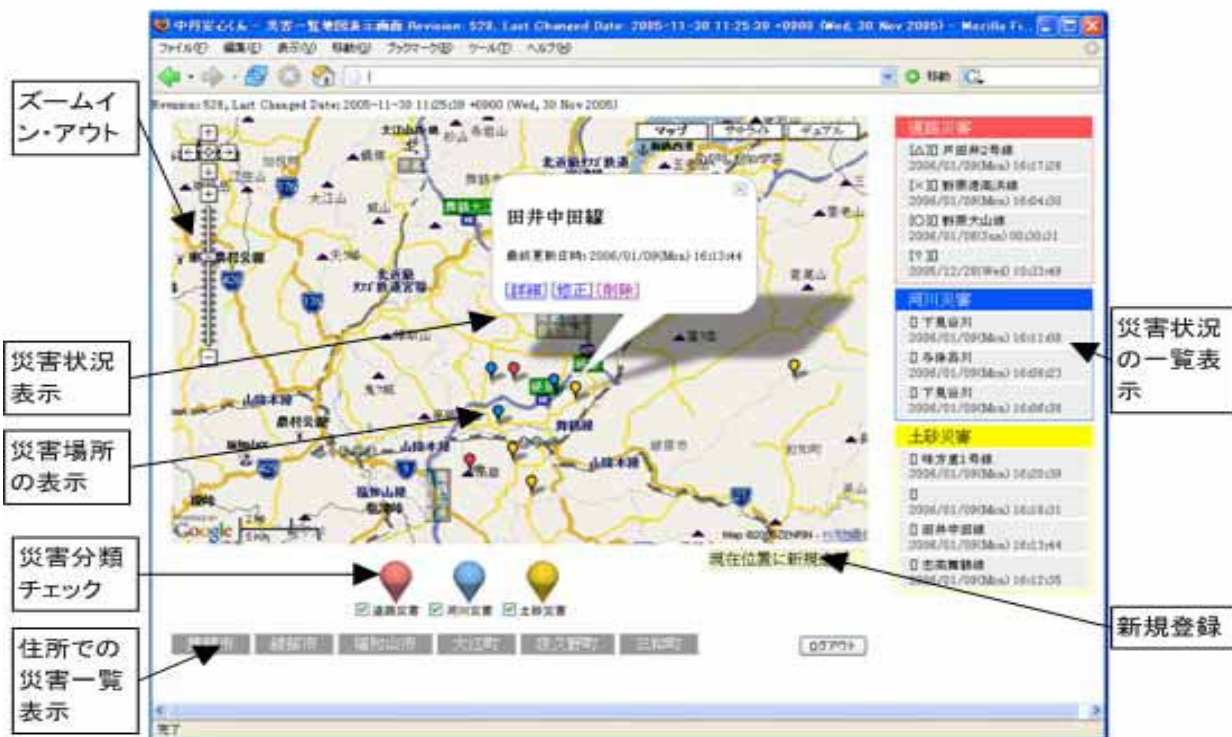
図 3. 地図上にマッピングされた災害情報