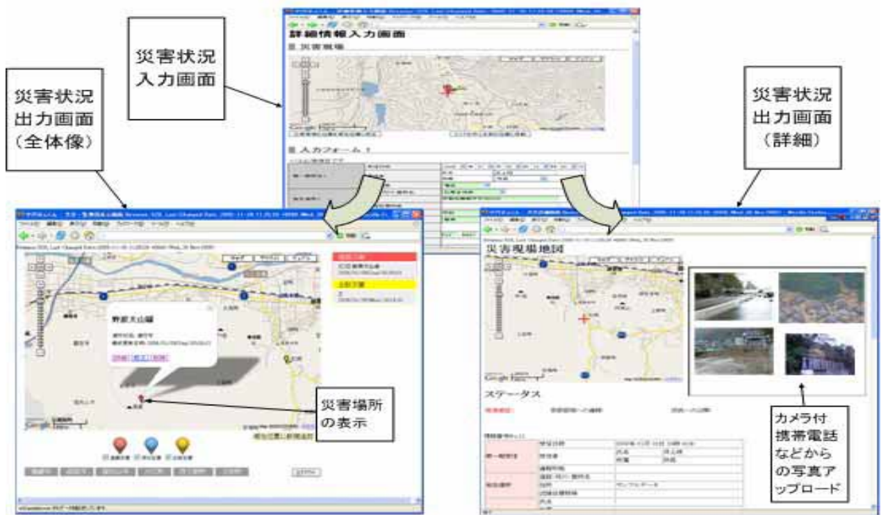
図 1. 災害情報入力・出力画面

以上の観点から、初期段階での情報共有を通じて災害初期対応時に必要な意思決定を支援するシステムの実現を試みた。