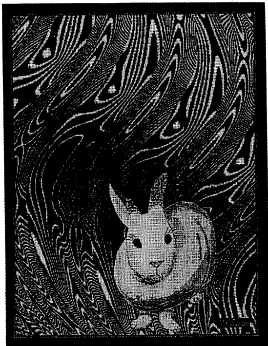
图 2 Rabbit