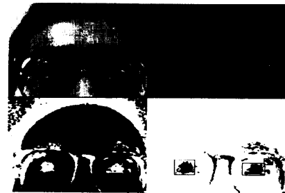
図 2: 目領域の検出

あらかじめ目領域の画像から辞書を作成し、複合類似度を用いて目候補を選択する (図 3 の 2 つの矩形領域が選択結果)。