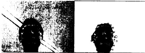
図 1: 顔領域の抽出例

さらに詳細に顔領域のみを抽出するためには、分離度 Snakes[2] を用いる。図 1 はその抽出結果である。