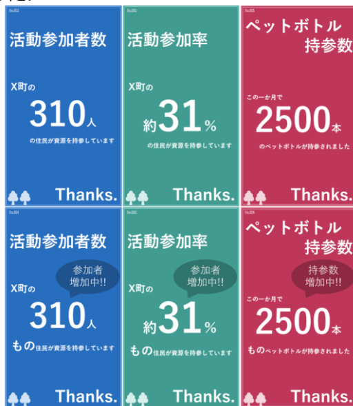
図 1 フィードバック画像一覧

めた。実験システムでは、最初にステーションについての説明を行い、ステーションへの来場意向スコアを 100 段階で評価させた。その後フィードバックを表示し、100 段階で再評価させた。フィードバックは 6 種類からランダムで一つ表示した。