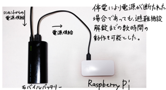
図2 避難施設に設置するシステム