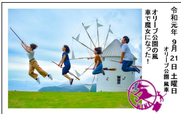
図 2. 生成される絵葉書

「撮影画像送信機能」, 「絵葉書表示機能」から構成される。「カダベールサーバ」は, 「画像認識機能」, 「絵葉書生成機能」から構成される。「絵葉書印刷アプリケーション」は, 「絵葉書印刷機能」から構成される。