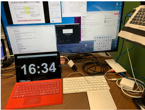
図 2 学会タイマーシステム