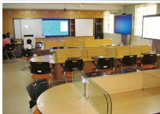
図-8 Mahinda Rajapaksa College の「ICT教室」とその壁に掲げられているパネル。韓国語で「先端 ICT 教室」とある