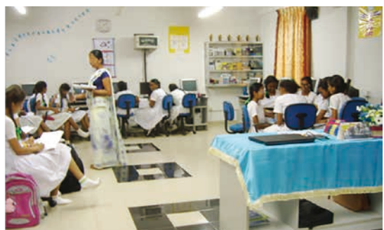
図-5 一般の生徒(左側)はシンハラ語で討議しているが、右側の輪の生徒は英語で討議している