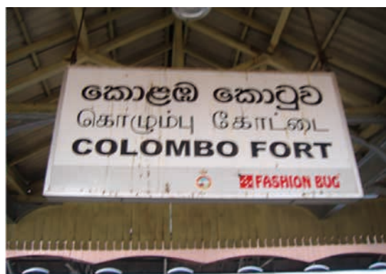
図-1 駅名表示：上からシンハラ語・タミル語・英語