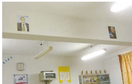
図-4 コンピュータ教室：Bill Gates と Steve Jobs の写真が掲げられていた

Saegis Campus という名の学校を訪問した。ここはスリランカの制度に基づく大学ではないが、提携する外国の大学のスリランカ国内校・専門学校・外国語学校の3つを兼ねている。もらった資料では、