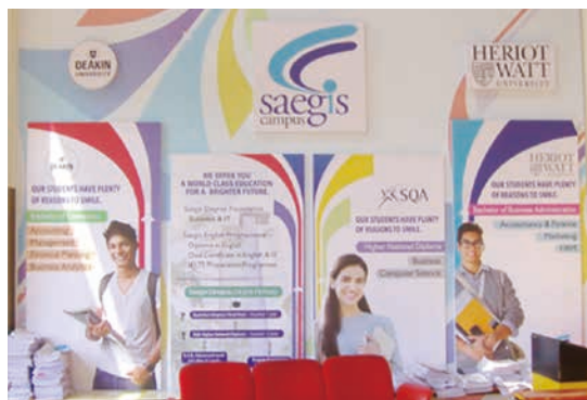
図-7 Saegis Campus 内のロビーに並んでいた、提携する各国大学の紹介

の意味でなく、Primary (5年)・Junior Secondary (4年)・Senior Secondary (2年)の次に学ぶところで、UniversityへはCollege (Collegiate)で2年間学んだあと入学する 1) 。