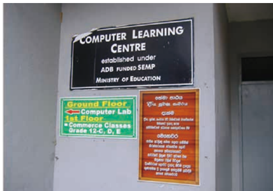
図-2 構内の掲示—英語のスペルはイギリス式