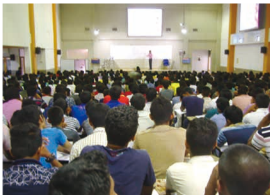
図-6 Saegis Campus の授業(おそらく数学)の風景。なおこの部屋だけでは入りきらずに別の部屋にも受講生を入れて生中継していた

次に Mahinda Rajapaksa College を見学した。スリランカでは College とは単科大学や大学内の学部