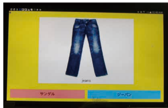
図-9 Mahinda Rajapaksa College の「ICT教室」の大画面ディスプレイに日本語学習の教材を表示したところ