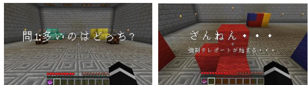
図1 教材内のテキスト表示および移動画面

本研究で利用するのは、 Minecraft を用いた立体認識、空間把握力を養うことを目的としたデジタル教材と、その効果を測るための事前・事後テスト、さらに意識調査のためのアンケートの3つである。教材に関しては、問題文の表示や問題間の移動などは自動で行われるように設計している(図1)。