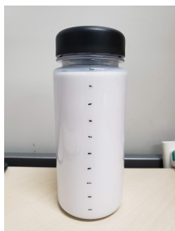
図 1: 実験に用いたプラスチック製の円筒形容器 サンプル数を 512, 窓関数をハミング窓とした高速フーリエ変換を使用する。