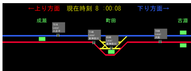
図1 通常運転時のシミュレート画面

各列車の上部には、その列車の列車番号、種別、行先を表示し、キーボード操作で表示と非表示を切り替えられる。路線の画面に映っていない部分は、タッチパネルでスクロールするか左右の矢印キーを操作することで視点を移動し確認ができる。また、描画範囲の大きさを変えたい場合は、キーボード操作によって画面の拡大や縮小ができる。