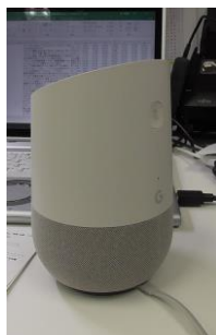
図 1 Google Home (Google AI スピーカー)

筆頭筆者は、大学病院の薬剤部医薬品情報管理室に勤務し、医薬品に関する質問に回答することを主とした業務を行っている。我々は、医薬品に関する質問について、AI スピーカーである Google Home (図 1) から正答が得られるようになれば、医薬品情報管理業務の軽減に繋がると考えた [1]。今回、当院で採用している医薬品銘柄名と、当院で実際にあった医薬品に関する問い合わせに対する Google Home からの回答について、正答率とその経時変化を調べたので報告する。