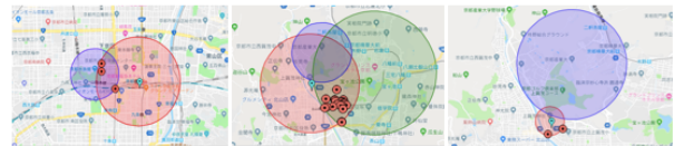
図 3: 空間演算による複数地点のスポット推薦例

図 2 に実装したスポット推薦システムのインタフェースを示す。プロトタイプでは、起点は現在地をデフォルトとし携帯端末より緯度経度を取得し、移動形態は徒歩 (80m/m) と車 (400m/m) とした。また、待ち合わせの場合を「meeting area」とし、遭遇を避けたい場