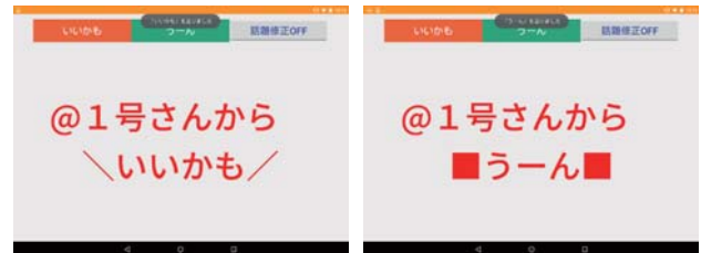
図 2 反応機能の表示例

と、参加者全員のクライアント画面上に、送信元の名前とともにメッセージが表示される。「いいかも」ボタンを押した際には、図 2 左に示すように「@○号さんから\\いいかも\\」というメッセージが表示される。また「うーん」ボタンを押した際には、図 2 右に示すように「@○号さんから■うーん■」というメッセージが表示される。