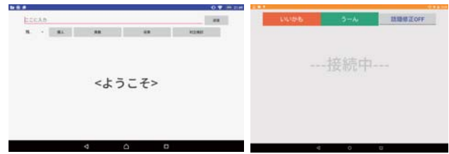
図 1 クライアントの画面

ユーザは、意思表示したいと感じた際に、画面上の「いいかも」ボタン、もしくは「うーん」ボタンを押す。する