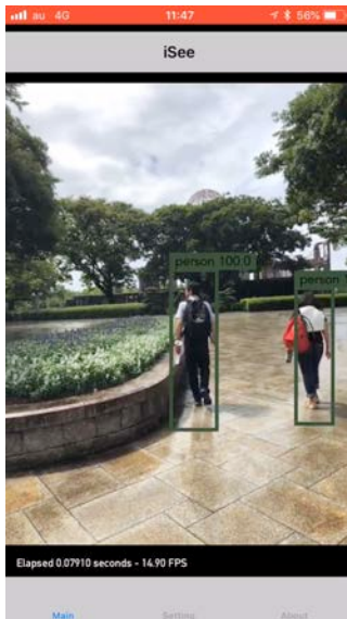
図 1 前回データセットを利用して原爆ドーム敷地内を認識した様子

ルを新しく追加した。植え込みと段差は首都大学東京日野キャンパスから豊田駅間の移動をもとにデータセット（以後前回データセット）を作成した際に既に含まれているが、前回データセットでは、本稿対象区域における植え込みと段差を検出することはほとんどできなかった。前回データセットの学習モデルを利用して対象区域の撮影動画を認識処理したものを図 1 に示す。人等の検出はされている。外観に地域差があるため、植え込みや段差等の検出ができなかったと考えられる。