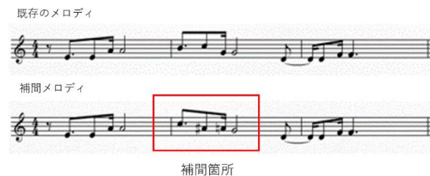
図3.既存楽曲のメロディと本手法による補間後のメロディとの比較 (パターン2)

することができていた。それ以上に、メロディ補間モデルから出力されたノートナンバーの並びの方がよりよいと思える出力を得ることができた。しかし、全体的な評価としては、欠損箇所4音をすべて正しく推測することができたテストデータは少なく、まだまだ工夫や改善が必要であると感じた。解決案としては、まず一つ目に、今回は中間層が1層であるニューラルネットワークを構築したが、中間層を複層にした深層学習とすることで、より精度の高いモデルを構築できると考えている。また、学習データの形式について、今回は欠損箇所を表現するのにランダム値を当てはめたが、欠損させたい箇所を0で表現したり、マスク処理を施してみたりと形式を変えて実験することも検討している。他にも、入力層のユニット数を減らし、欠損箇所を入力しない方法なども試してみたい。これらは今後の課題である。