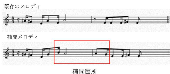
図2.既存楽曲のメロディと本手法による補間後のメロディとの比較 (パターン1)