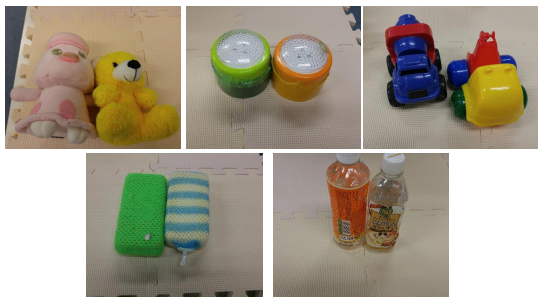
図 2: 実験に用いた物体