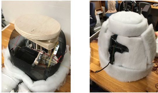
図2: (左) ロボット基盤. (右) 綿で覆った様子.