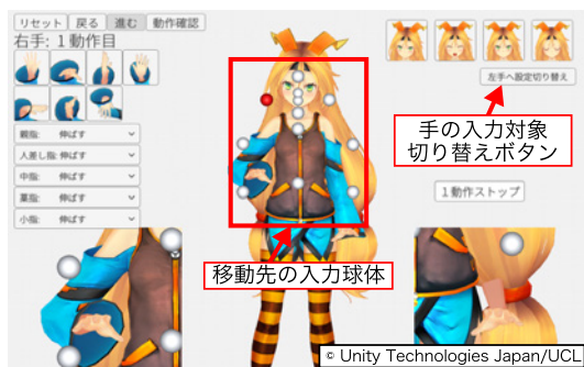
図 1: 提案システムにおける入力インターフェースの画面