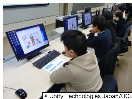
図 4: 各提案手法の評価実験の様子