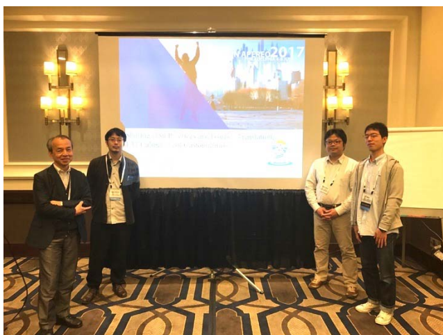
図 2 Ja Sakai セッション発表者

はじめに法政大学から“Community Translation of Sakai using Transifex”というタイトルで Web ベースの翻訳システムである Transifex を使った Sakai 翻訳基盤の報告を行った。本システムは日本だけでなくスペイン、トルコ、スウェーデンが Sakai の翻訳に利用している。システムの概要は 2016 年に発表したもので、今回は発表者らが開発した Web ベースの用例集である POBrowser および PO ファイルをやり取りする I10n ツール、さらに Transifex および GitHub との関連に関し翻訳ワークフローを交えて解説した。