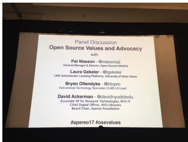
図 4 パネルディスカッション パネリスト