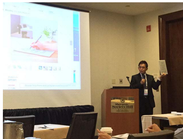
図 3 京都大学主催セッションの様相

Experience Enhancement Using Sony Digital Paper”[4]というセッションで、SONY 社製 Digital Paper と Sakai との連携の事例報告を行った。図 3 には発表中に撮影した発表者の写真を示す。Digital Paper は米国でも販売されており、日本人参加者以外にも多数の参加が得られた。海外でも販売されるシステムにとっては、こうした国際的な場で発表する意義があると考えている。