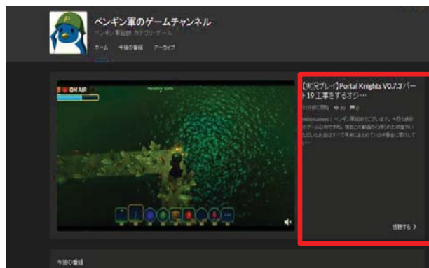
図1 チャンネルが配信する番組の詳細(画面右)

普段視聴しているチャンネルの番組であるか、または、新しいチャンネルの番組を視聴する場合は、チャンネルが配信する番組の詳細(図1)、ハッシュタグ(#freshlive)が付加された Twitter のツイート等の限られた情報から視聴したいと思う番組を直感的に選ぶこととなる。また、新しいチャンネルを知る手段として、FRESH!の関連チャンネル(図2)という視聴しているチャンネルと同じカテゴリの番組を新しく配信した5チャンネルを紹介する機能が存在する。