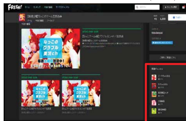
図2 視聴チャンネルの関連チャンネル(画面右下)