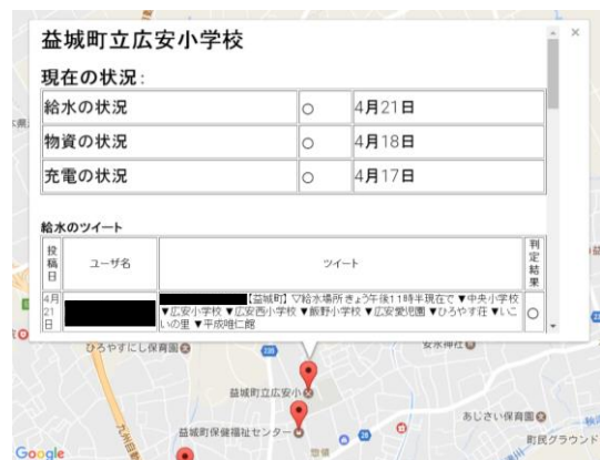
図2 リアルタイム災害支援マップ

給水所の所在地に重畳したリアルタイム災害支援マップを構築した。そして、実験結果から提案手法の有用性を確認した。一方で、行政からの指定がない避難所や給水所に避難した被災者のニーズを網羅できない課題の解決や、精度向上に向けたシステムの改善を行う必要があることが明らかになった。今後は、避難所や給水所の状況を現認できるユーザからのフィードバックを受けて、システムが提示する避難所の状況を適切に更新する仕組みを構築する。同時に、学習モデルの再構築を行い、精度向上を図る。