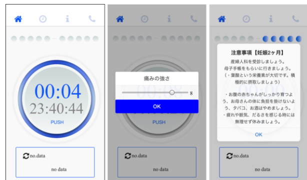
Fig.2 計測表示・痛み・情報リマインド表示

アプリケーションのチュートリアル機能では、お産に関する一般的な知識が学習できる。また、計測したデータに対して、マタニティは医療者の知見をもとに作成された注記を選択し、参照できる。計測した間欠時間によって、①20分以内, ②30分以内, ③30分以上の時間幅で3種類の注記を表示可能とした。各注記はその時点における留意点を示し、破水や多量の出血がないか確認を促す。妊娠週数に応じたアプリケーションの出力情報はマタニティの主観的入力に依拠しながらも、妊娠周期に異常を感じた場合は、早期に医療機関に連絡する注意喚起表示をするようにした。