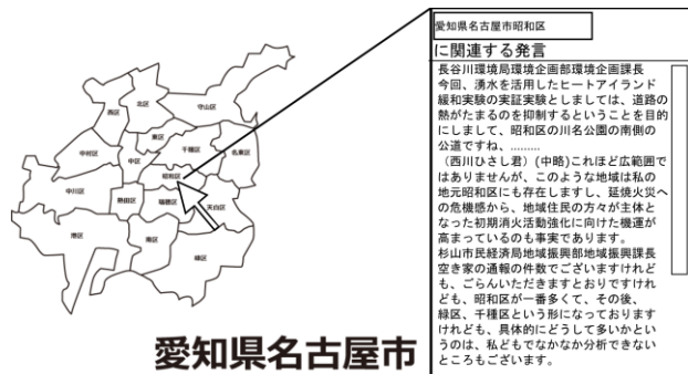
図 2: 地図から検索するインターフェイス

図 2 では、閲覧したい地域を選ぶ事でその地域に関連する発言を閲覧する事ができる。