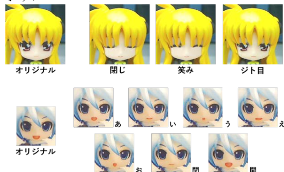
図3 顔パーツ変形結果

撮影対象 (上):ねんどろいど ぶち 魔法少女リリカルなのは The MOVIE 1st フェイト・テスタロッサ (私服) フェイト・テスタロッサ ©NANOHA The MOVIE 1st PROJECT (下):同図1