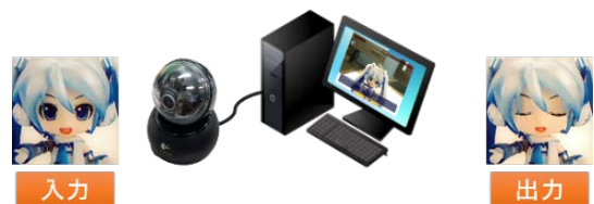
図1 システムの構成と入出力

本システムはリアルタイムにAR表示を行うクライアントと、発話内容やフィギュアの種類などを識別するサーバから構成される。サーバはキャラクターの発話文を保存したデータベースであると同時に発話文の選択処理を行う。また、発話文選択のためにフィギュアのキャラクター識別の機能を有する。一方、クライアントは入力装置としてカメラを、出力装置としてディスプレイとスピーカを有するデバイスである。図1にシステムの構成を示す。システムによりフィギュアの顔が変形し、発話文が音声と画面へのテキスト表示で出力される。