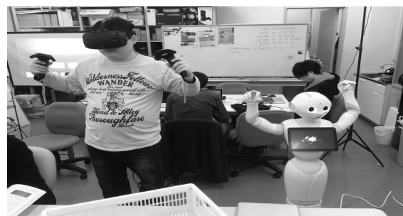
図3 操作者の動きを Pepper で再現

これらの機能を利用して, 操作者は Pepper 周辺の状況を詳しく把握することが可能である.