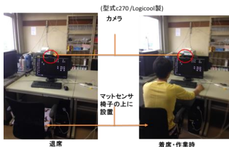
図2 実際の実験風景

今回は2台の PC に各スマートタップとマットセンサを設置した。時間表示には Visual Basic2015 で作成した専用アプリを使用した。実際に実験を行った様子を図2に示す。