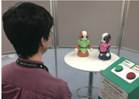
図 2 実験風景