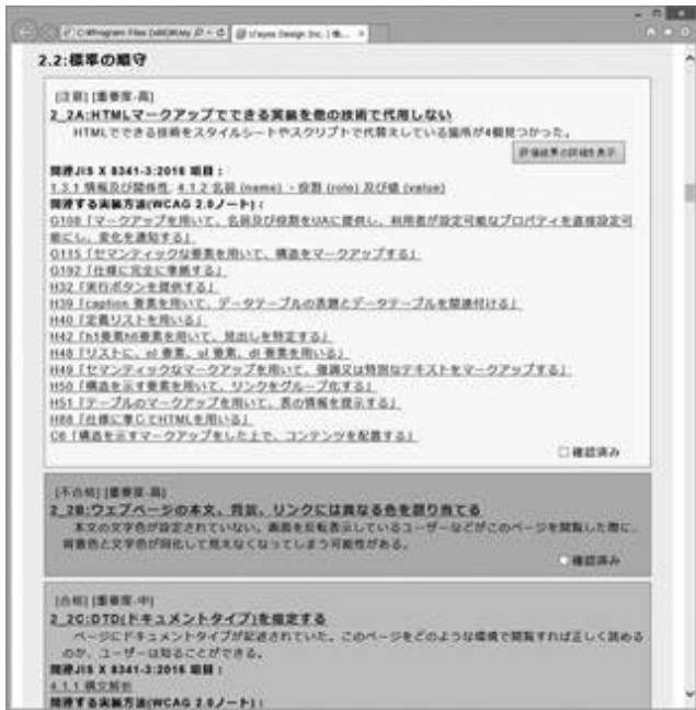
図 3 WAIV 評価結果画面