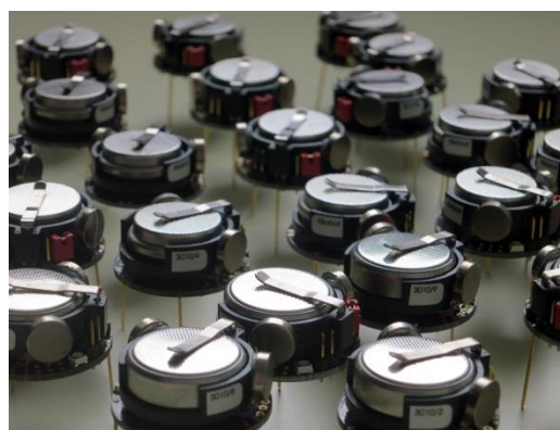
図3. 自己組織化するロボット