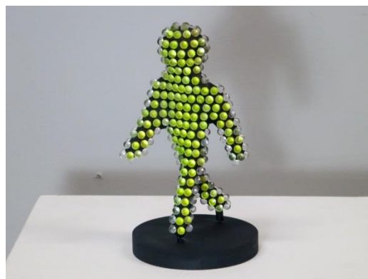
図2. 視線方向に応じて表面色が変化する立体