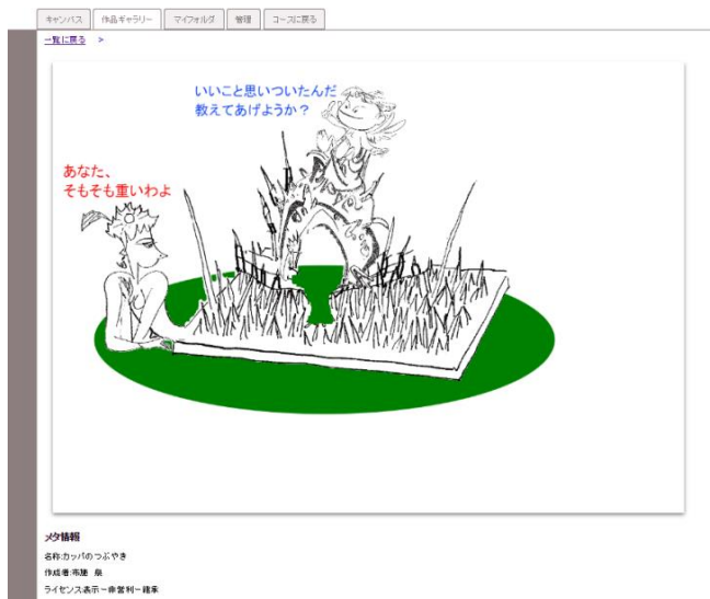
図5 「作品ギャラリー」の画面例（一覧と詳細）