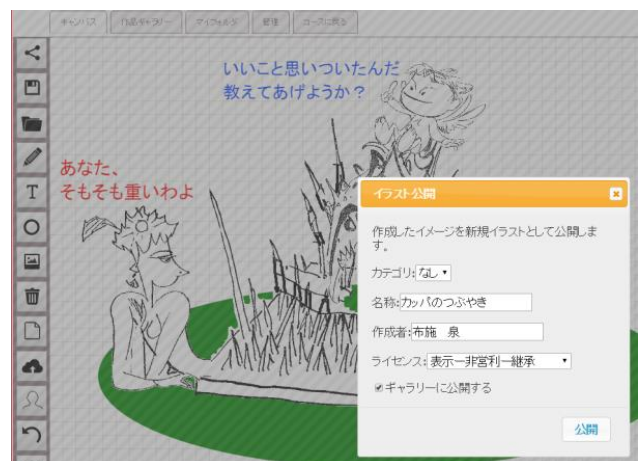
図4 イラストの公開画面例

完成した編集著作物となり得る作品は、イラストの公開アイコンから公開することができる。その際、図4に示される通り、作品名称(タイトル)、および作成者名を記述し、ライセンス表示と表示カテゴリを選択した上で公開する。また、本画面で、ギャラリーへの公開をチェックすることで、当該作品を同時に作品ギャラリーにも登録することができる。なお、この公開画面に表示させる内容は、メタ情報として後述する管理タブにおいて、個別に設定することが可能である。