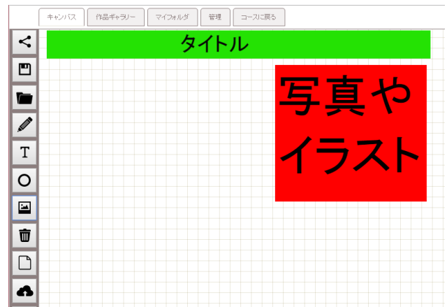
図8 配置に一定制限を課すための素材の提供例

解釈が一般になされており、その理解を実践とともに確認する学習には意味があると考えている。