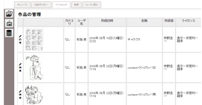
図6 「マイフォルダ」の作品管理の画面例

同様に、作品ギャラリーの管理では、作品ギャラリーに公開した作品についても、削除やコメントの再入力を可能とする。また、公開したイラストの中から、新たにギャラリーに登録することもできる。保存データの管理では、キャンパスで作品を創作している段階で、一時保存したデータを確認することができる。