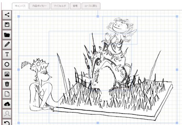
図2 キャンバスにイラストを追加し構成した画面例

図2は、素材となるイラスト4つ(カッパ、ヤドカリの殻、棘、天使の少年)を組み合わせて、画面を構成した例である。その際、画面を構成する素材は、著作権情報として、図3のように、各著者の画像が表示されるように設計し、画像全体における各素材の寄与を一覧できるように工夫した。