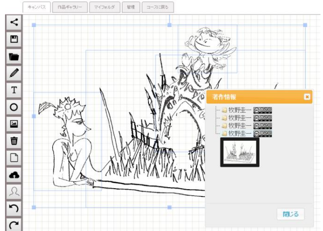
図3 著作権情報における利用イラストの表示例

図2は、素材となるイラスト4つ(カッパ、ヤドカリの殻、棘、天使の少年)を組み合わせて、画面を構成した例である。その際、画面を構成する素材は、著作権情報として、図3のように、各著者の画像が表示されるように設計し、画像全体における各素材の寄与を一覧できるように工夫した。