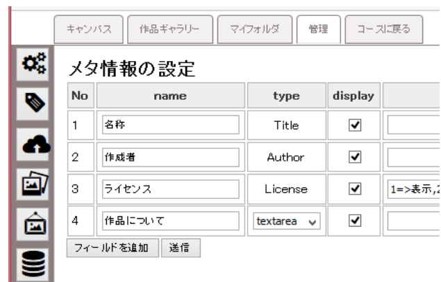
図7 「管理」タブにおける作品管理の画面例

創作エディタにおける管理タブは、Moodleの教師ユーザのみに表示される機能である。イラスト公開時におけるメタ情報の設定、カテゴリの管理、素材となるイラストの一括アップロード、公開されたイラストの確認・管理、作品ギャラリーの管理等が可能である。