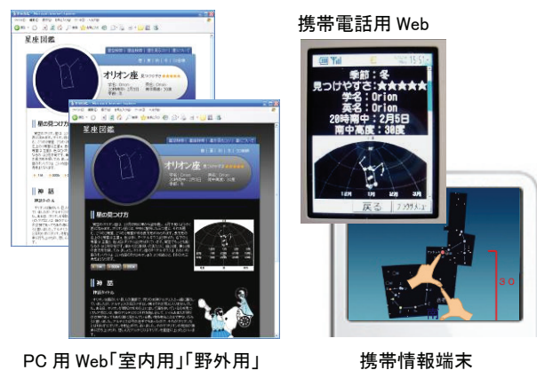
図1. 学習環境や利用機器を考慮した教材提供

情報を野外に持ち運び、学習することができるように、携帯電話のWebや携帯情報端末のPodcastingにも対応させる。特に、Podcastingは、星座観測を支援する動画コンテンツを、手軽に携帯情報端末に転送できるので、野外での学習に適している。