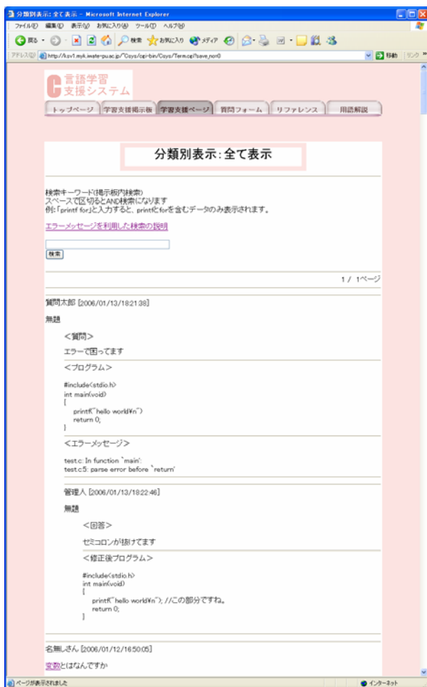
図 2 学習支援ページ

本稿の支援システムは、学習者が質問をするための Web ページと問題解決用のデータベース、管理者が回答等の管理を行う Web ページを提供する。学習者は Web ページ上にエラー修正等についての質問を行い、管理者が Web ページ上に回答を行う。解決された質問の情報はその後、他の学習者にも閲覧できるように整理し、学習支援ページに公開される (図 2)。