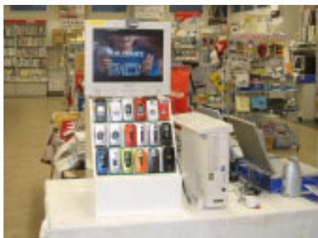
図 2 実験風景

RFID を使った提案システムの取得データの正当性、マーケティング用途への適用性を検証するため、実証実験を行った。